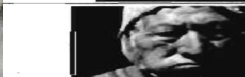
Akullicadores en el Tiwanaku